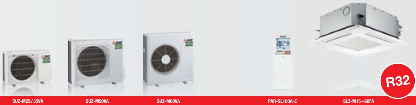
SUZ-M25 / 35VA