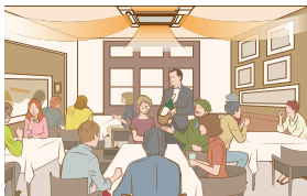
Teljesen foglalt helyiség